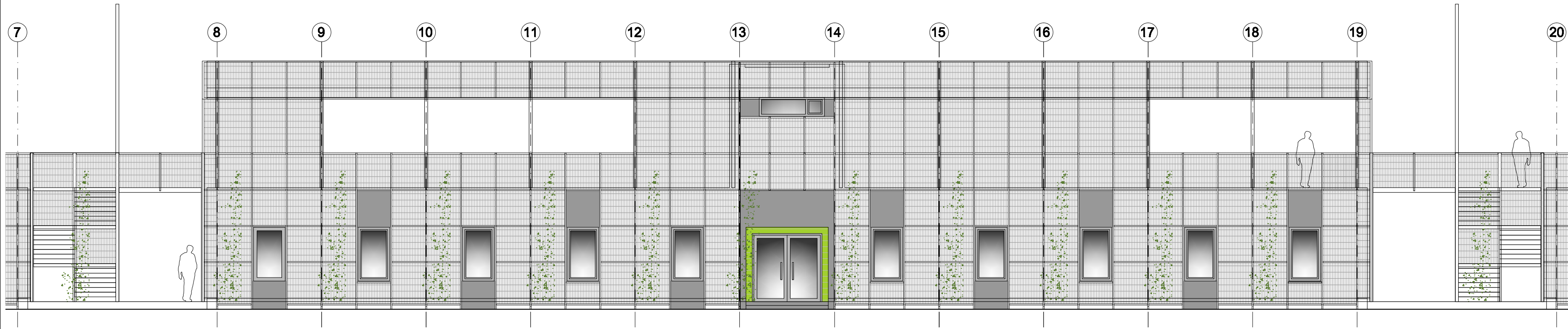
BUDYNEK 2 –ELEWACJA ZACHODNIA